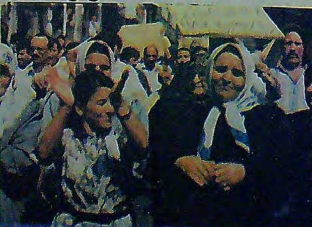
22 Temmuz ortak kamu eylemleri çerçevesinde gerçekleştirilen toplu vizitede Üniversitenin kadın işçileri yürüyüş boyunca en öndeydiler..

Bu arada polisin tavrı ıslık ve alkışlarla protesto edildi. Demiryolu işçilerinin dispanserden ayrılmasından sonra yemekhane işçileri vizite kağıtlarını teslim ettiler. Üniversite tatil olmasına rağmen eylem oldukça geniş bir katılımla gerçekleşti. Yürüyüş boyunca "İşçi-Memur Elele Genel Greve", "Çankaya'nın İşçisi Düşmanı", "İşçiler Gelecek Hanedan Gidecek", "Vur Vur İncisin Çankaya Dinlesin" sloganları atıldı.