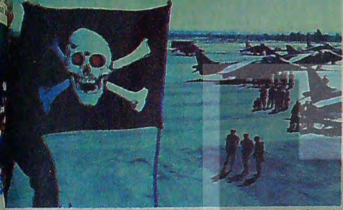
Üretimin yaşamını kurtaran (!) Amerikalı askerler, gerçekte, ABD'nin Ortadoğu korsanlığına, Türkiye devletinin gönüllü desteğinden mutluluk duyuyorlar!